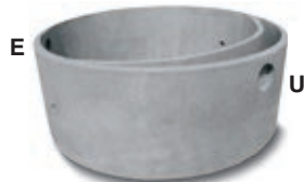
An. terminale sedim.