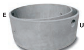
An. terminale sedim.